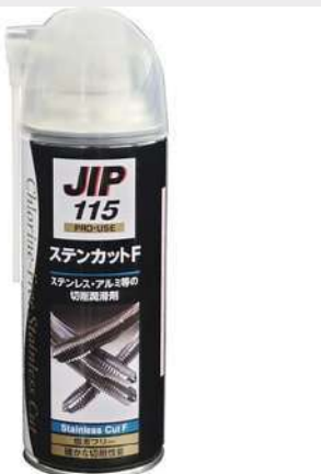
塩素化パラフィン 非含有切削スプレー 420ml イチネンケミカルズ ステンカットF