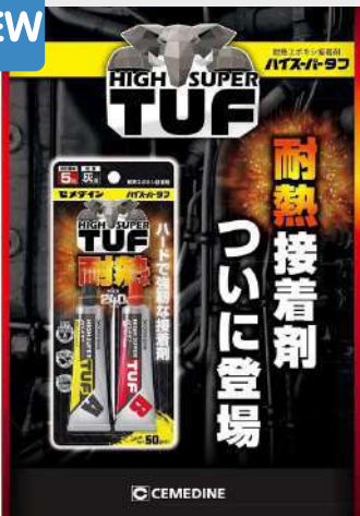
耐熱エポキシ接着剤 ハードで強靱な接着剤！耐熱温度MAX240℃ セメダイン ハイスーパータフ 50gセット