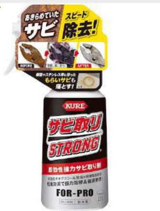
即効性 強力サビ取り剤 ジェルタイプ 250g KURE サビ取りストロング